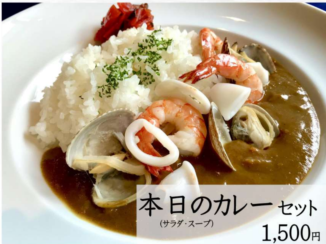
本日のカレーセット (サラダ・スープ) 1,500円