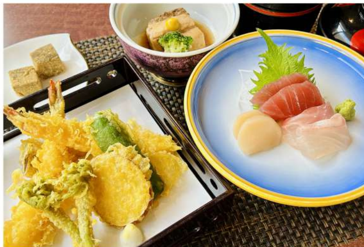
こけし膳 (天麩羅・刺身・角煮・御飯・味噌汁) 1,800円

・ご飯単品 200円・ご飯大盛 +110円・パン単品 200円・粉チーズ 100円