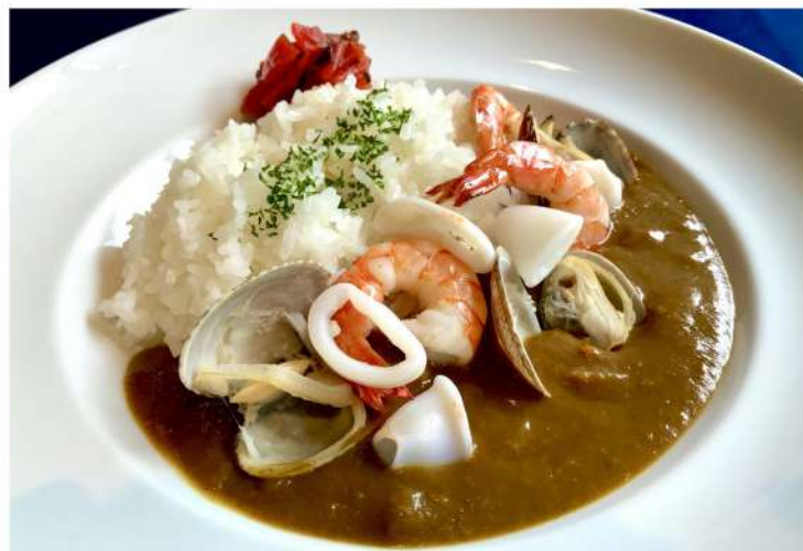
本日のカレーセット (サラダ・スープ) 1,500円